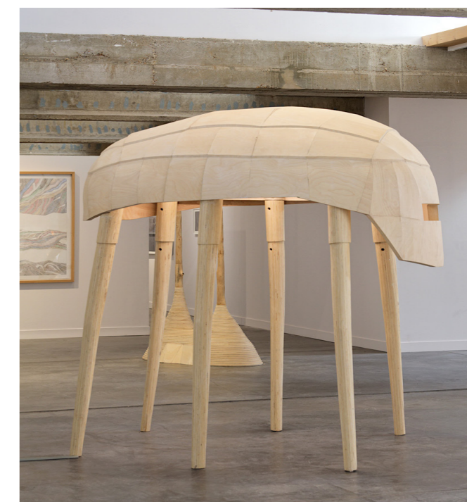
Tegmentum , Clément Bagot. 2,20 x 1,40 x 2,30 m. Bois peuplier, bouleau, métal et dispositif lumineux.

Commissaire de l'exposition Multimondes Multiples de Clément Bagot au centre d'art contemporain d'intérêt national Les Tanneries en mars 2024 .