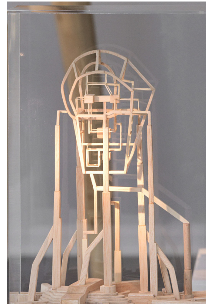
Aedificium , Clément Bagot, 2023. 20 x 29 x 47 cm. Bois Balsa, plexiglas.