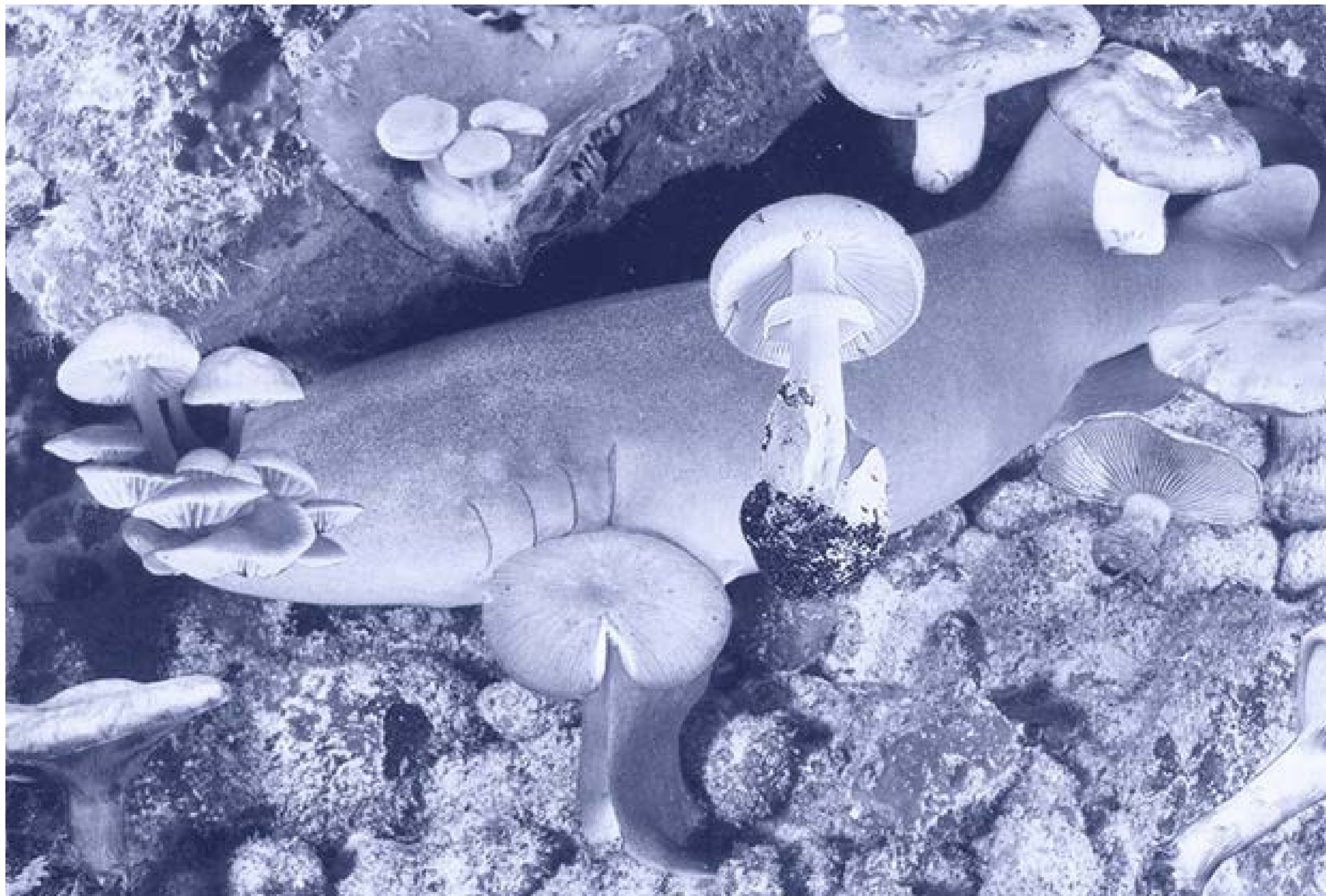
Requin des Bois I , Laurent Le Deunff, 2015. Tirage pigmentaire sur papier Hahnemühle. 110 x 169 cm.