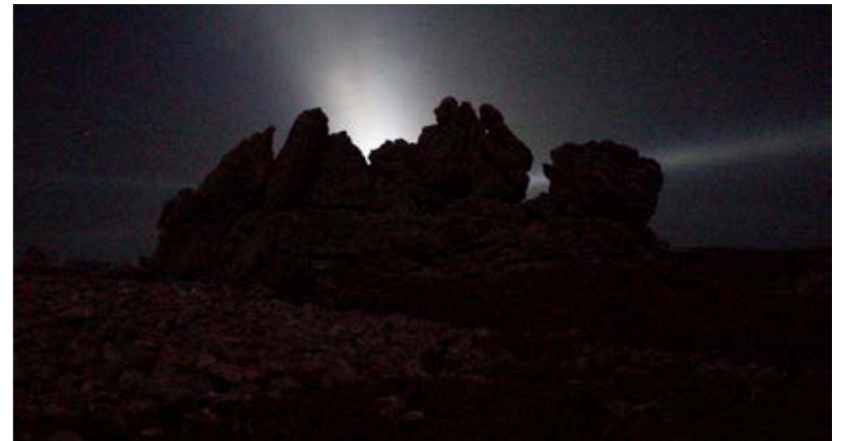
L'ÎLE SENTINELLE , 2026. Anne-Charlotte Finel. Tryptique vidéo, bande sonore multicanale Nicolas Charbonnier, 20min. Courtesy de l'artiste et de la galerie Jousse Entreprise, ADAGP.