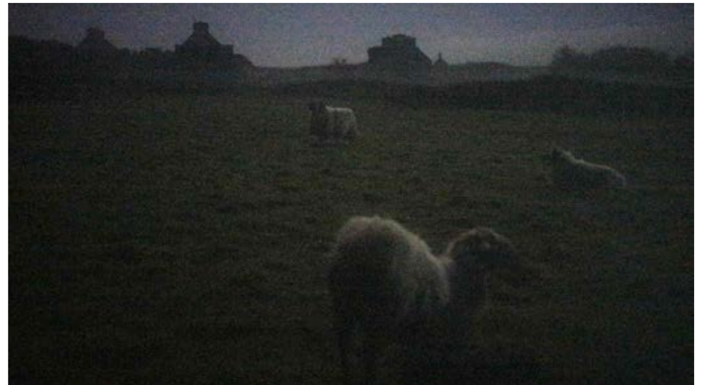
L'ÎLE SENTINELLE , 2026. Anne-Charlotte Finel. Triptyque vidéo, bande sonore Nicolas Charbonnier, 20min.