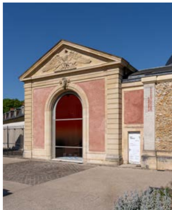
Vue du centre d'art depuis la Place des Manèges. Exposition Hot topics de Fragmentin, 2025.

La Maréchalerie est membre du réseau TRAM qui organise les TAXI et RANDO TRAM, visites d'exposition et rencontres en présence des artistes invités et les équipes des structures.