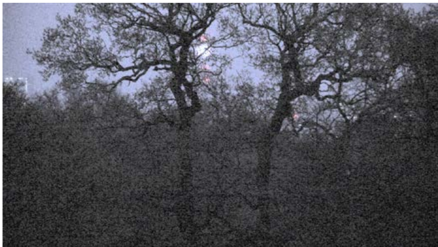
ENTRE CHIEN ET LOUP , 2015. Anne-Charlotte Finel. Vidéo HD, musique Voiski, 5min44. Courtesy de l'artiste et de la galerie Jousse Entreprise, ADAGP.