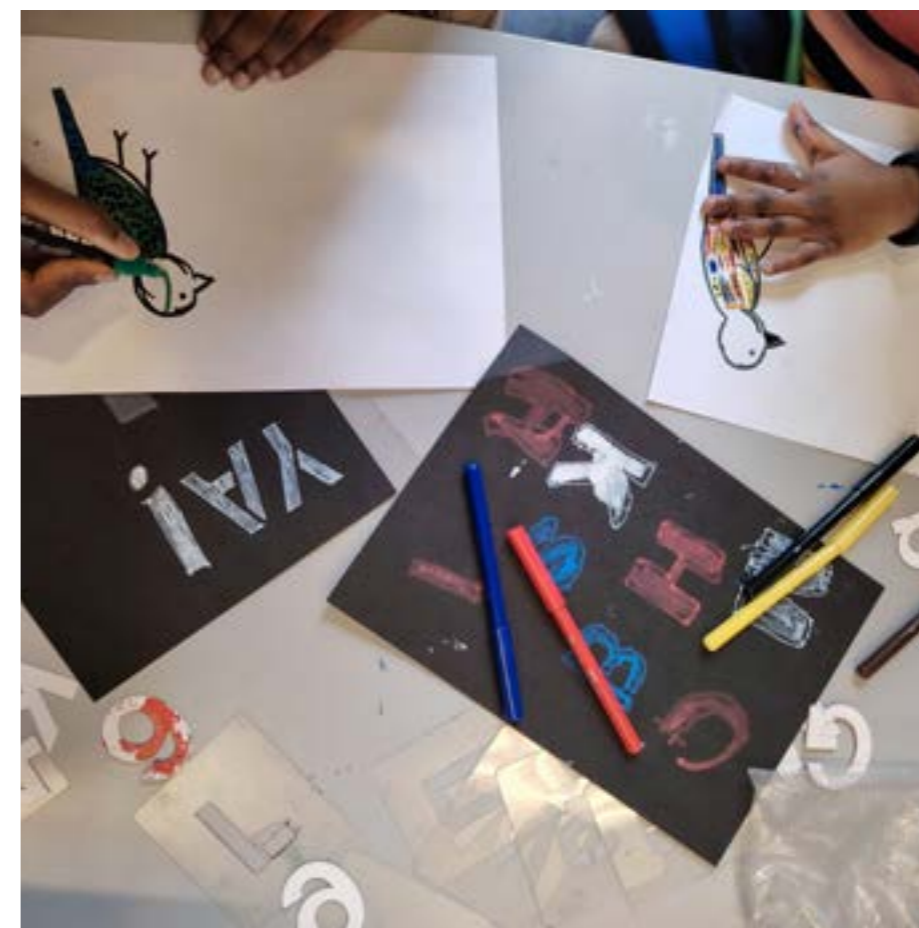
Atelier d'expérimentation. Exposition La moindre anomalie de Dominique Petitgand, 2026.

VISITES-ATELIERS ENFANTS DE 6 À 12 ANS Les samedis 30.05 et 27.06 de 14h30 à 16h Gratuit sur réservation inscriptions à lamarechalerie@versailles.archi.fr