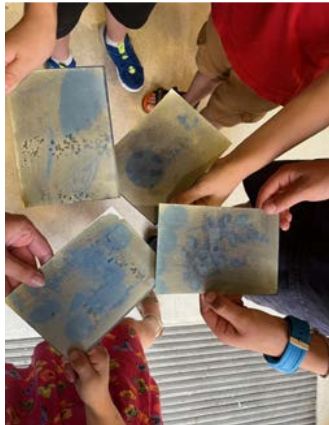
Photographies de visites et ateliers, saison 2024-25, La Maréchalerie - centre d'art contemporain / ÉNSA Versailles Exposition Passage portée _ Clément Bagot _ Accueil des 2 1/2 & 3 ans du Multi-accueil Borgnis-Desbordes, Versailles. Exposition Hot topics _ Fragmentin _ Accueil des 6-12 ans _ Visites - Ateliers du samedi

Pour chaque exposition, une œuvre est conçue et présentée dans l'espace de La Maréchalerie. La rencontre avec l'œuvre procède par immersion. Les visiteurs entrent en contact avec des images, des formes, des notions.