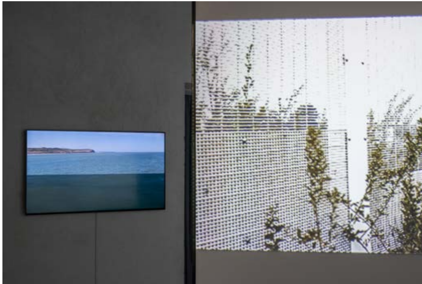
Vue de l'exposition L'Atlas des 2-mers : déplacement de Frank Smith. La Maréchalerie - centre d'art contemporain / Énsa Versailles, 2024.

Chaque année, La Maréchalerie édite ou co-édite plusieurs publications. Pensées comme documents d'artistes, elles prolongent une recherche artistique initiée à l'occasion des productions in situ présentées au sein du programme d'expositions. Elles donnent de nouveau la parole aux artistes, et à des contributeurs invités à produire un regard inédit sur une oeuvre, à partir de leur spécialité.