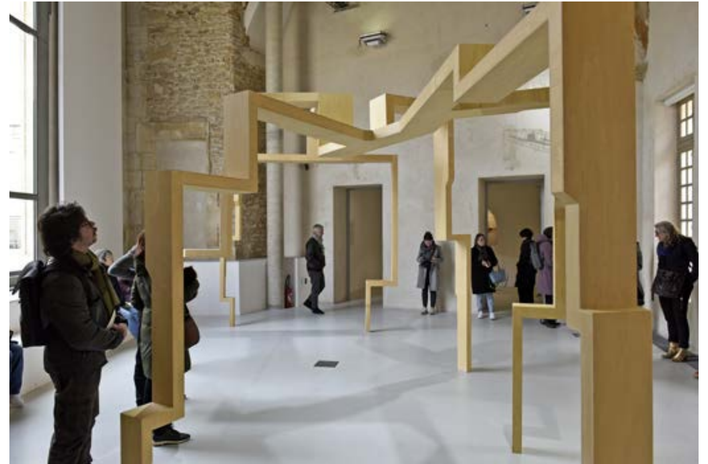
TRAM. TaxiTram 15-mars-2025. Clément Bagot. La Maréchalerie

4 ter, rue de la Solidarité 75019 Paris info@tram-idf.fr www.tram-idf.fr