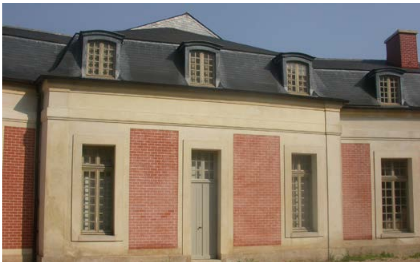
Entrée La Maréchalerie - centre d'art contemporain depuis la cour de l'ÉNSA Versailles