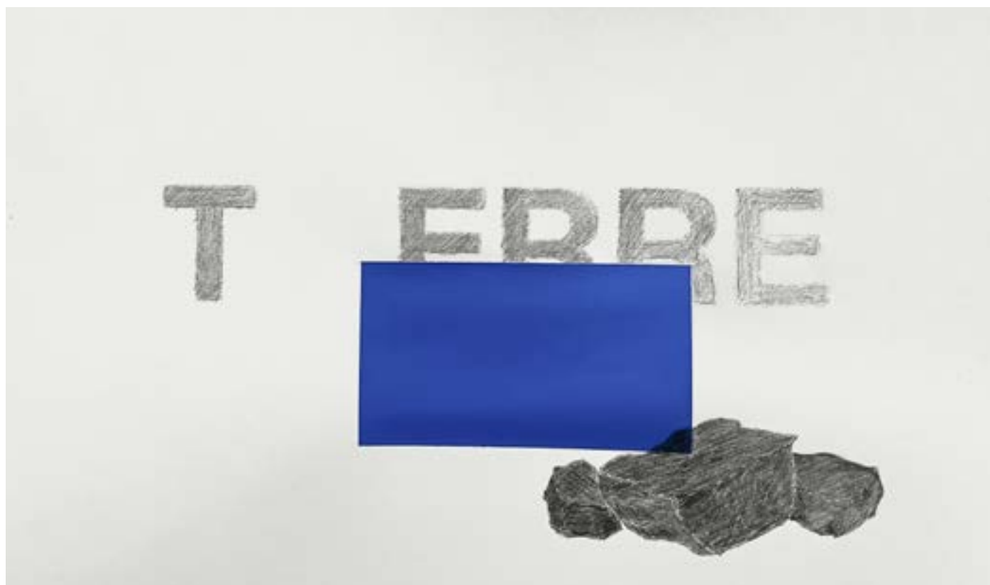
Étude , 2024, 30 X 40 cm, graphite et bleu incrustation © Bernard Calet, ADAGP Paris

BERNARD CALET_ LOINTAINS 03.10 - 14.12.2025