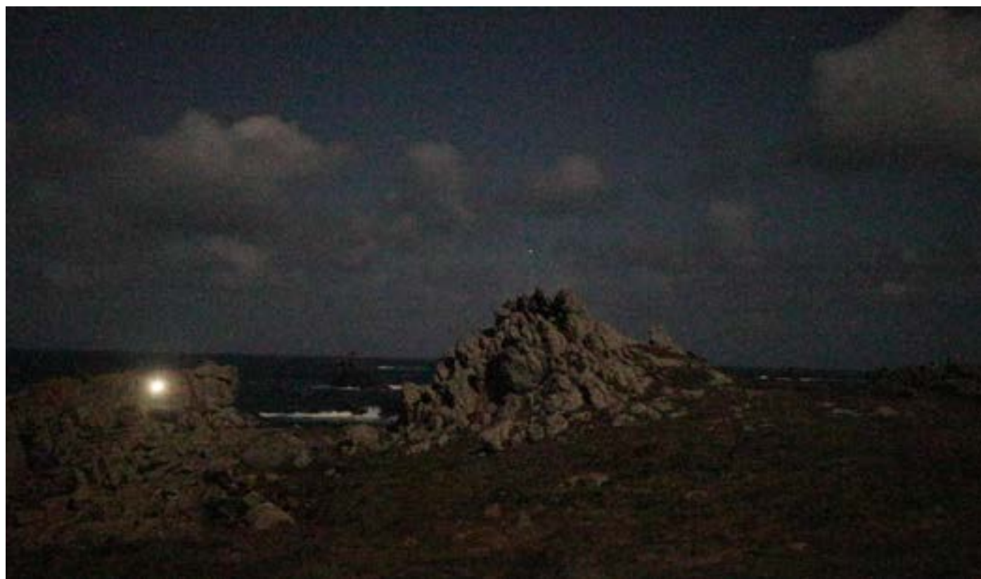
L'île Sentinelle, 2025-2026, vidéo HD, oeuvre en cours