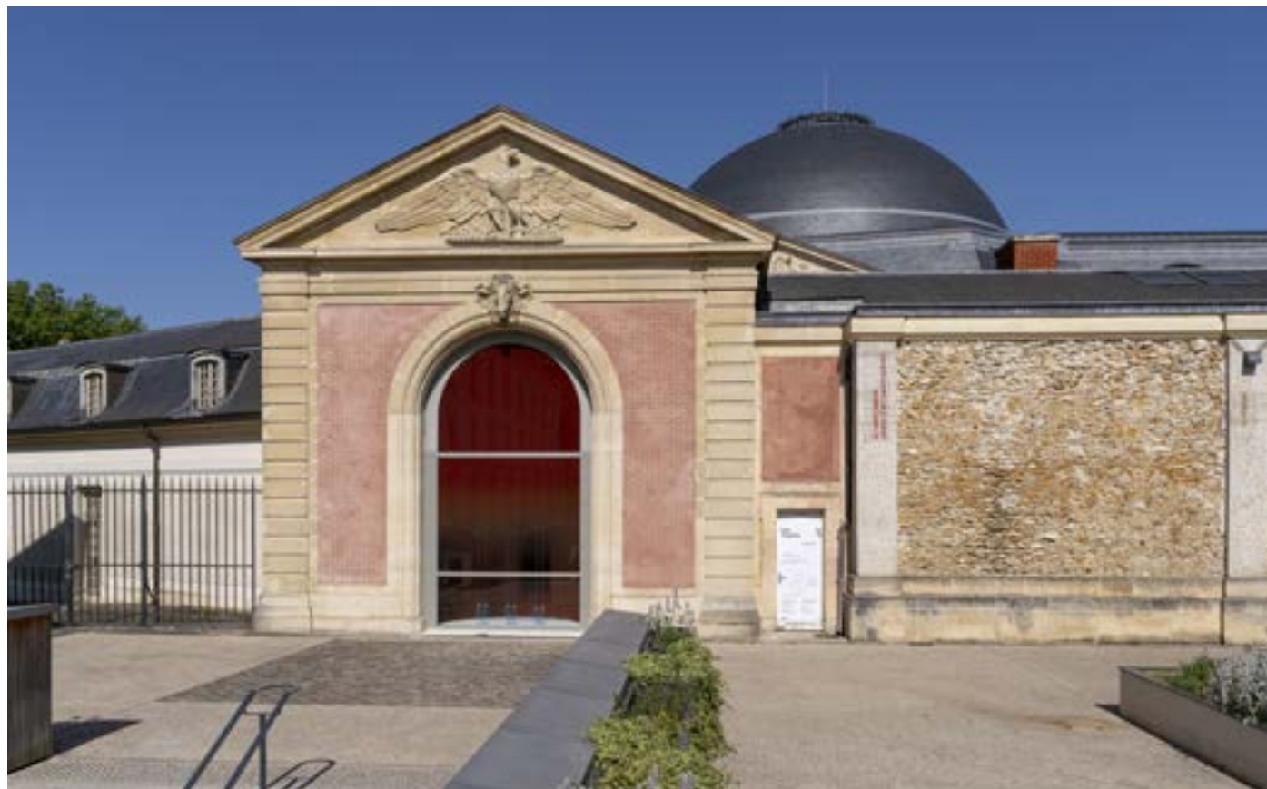
La Maréchalerie - centre d'art contemporain depuis la ville place des Manèges © Nicolas Brasseur. 2025 Exposition Hot topics © Fragmentin. 2025