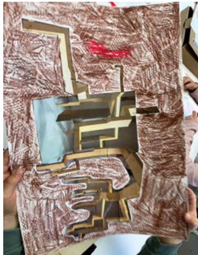
Projets ACTE 2024-25 © La Maréchalerie - centre d'art contemporain Ecole élémentaire Lully Vauban, Versailles. Artsite invitée : Morgane Porcheron. Atelier de création en classe. Ecole élémentaire Caroline Aigle, Le Chesnay. Artiste invité : Romain Vicari. Visite de l'exposition Clément Bagot.