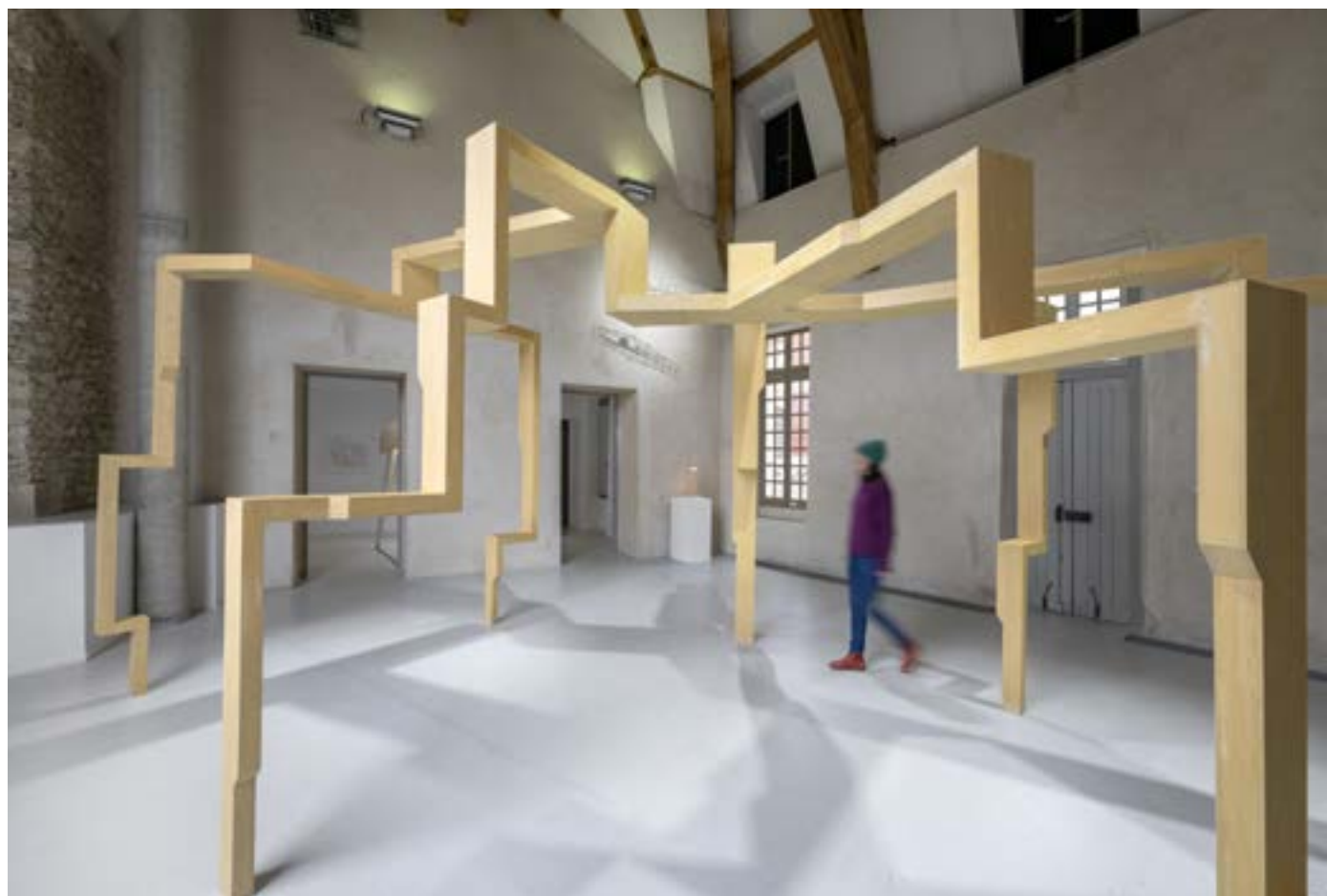
Vue de l'exposition Passage portée de Clément Bagot. La Maréchalerie - centre d'art contemporain / Énsa Versailles, 2025.