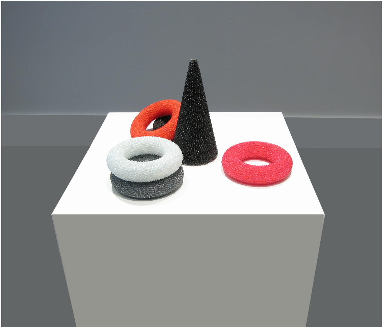
▲ Le jeu, 2006. 6 éléments, technique mixte, dimensions variables.