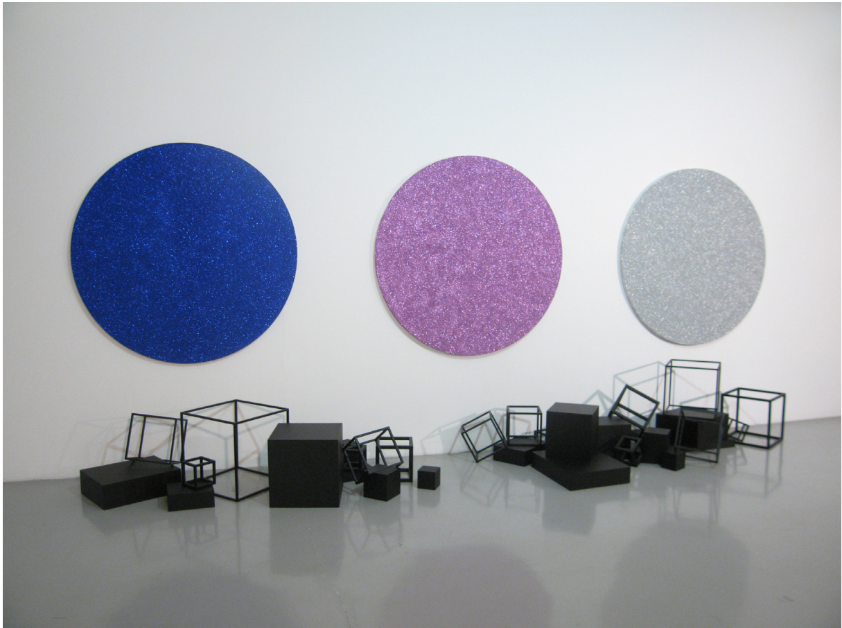
▲ Black Out. 3 tondos de 120 cm de diamètre, paillettes et laque sur toiles et 33 structures en bois. Dimensions variables. Vue de l'exposition « Nice to meet you », Musée d'Art Moderne et d'Art Contemporain de Nice, 2007.