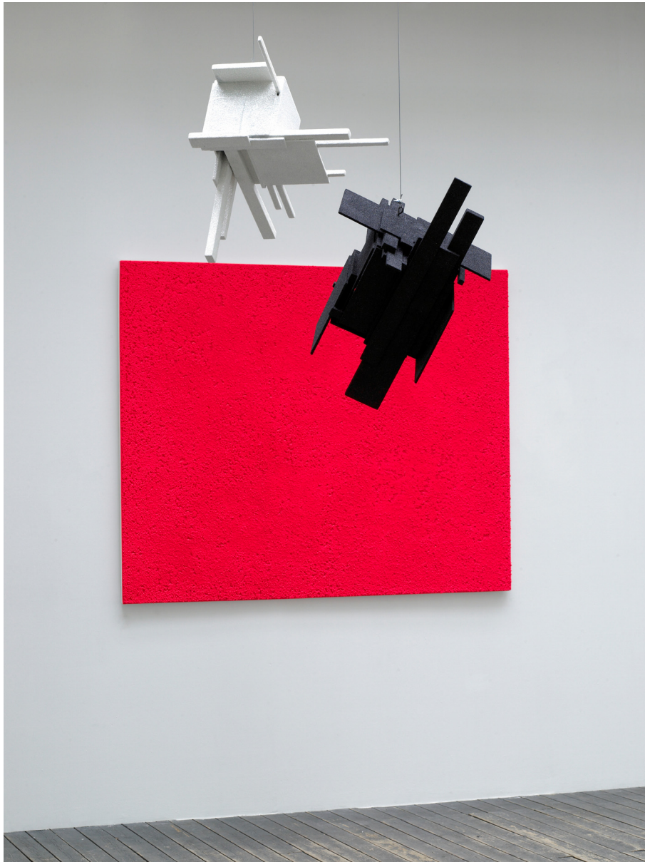
▲ Vue partielle de l'exposition « Posturale attitude », galerie Les filles du calvaire, Paris, 2007