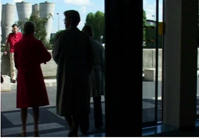
Marc Petitjean, Document pour une commande publique, 2004