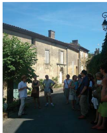
Visite commentée de Saint-Emilion.