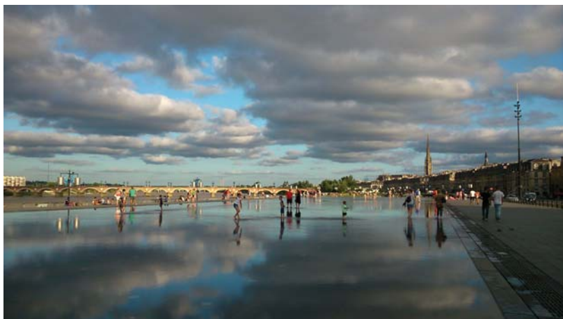
Bordeaux – le miroir d'eau, Jean-Marc Llorca, Michel Corajoud.

Enfin, la dernière journée fut l'occasion de faire le point sur les commissions du réseau archirès : commission numérique, recherche, audiovisuelle, cartes et plans, formation, de catalogage, du portail, de Koha, de la communication, du SGDE... et de discuter sur des points précis, propres au réseau, comme le développement du SGDE, l'avenir et l'évolution du portail documentaire archirès.